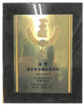
今年は金賞を頂きました！

30匹の猫の集団が表彰されるとは、想像がつかない。あたりまえの日常の繰り返しが大事だと思う。