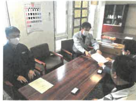
各社に事故防止の取り組み要請をしました

毎年恒例の「年末年始無災害運動」が始まります。毎年運動期間中に安全パトロールを実施していましたが、