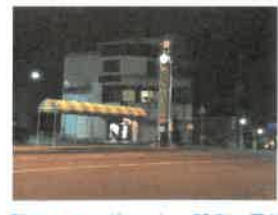
駅前なのにポツと一軒家の風情

失うことを空虚ととらえるか、再出発ととらえるか。荒涼とした大地にも草木は生える。未来は常に明るいものだ。と信じたい。