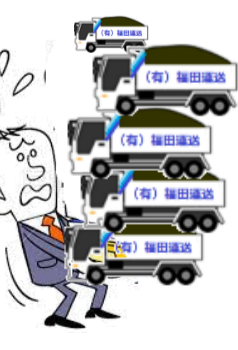
もっともっと ダンプが必要だ..

毎年のことであるが、秋から年末にかけてダンプの不足が顕在化した。岩手県内陸北部において、特段の工事があるわけではなく、穏やかな市場なのであるが、気が付くと車両の老朽化、運転手の高齢化、新規採用の減少により地域の輸送能力は減少している。工事情報の共有により計画的な配送調整が必要となるかもしれない。じわじわと迫る課題である。