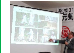
御所野縄文博物館館長高田様より縄文 人の生活とところを探ると題しましてお話し していただきました！