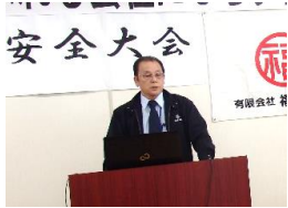
この大会をいつもと同じように過ごさないで、 しっかりした気持ちで参加するように！