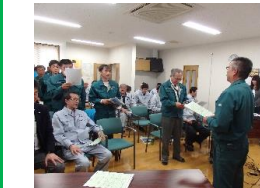
各部署ごとに安全の誓いを大きい声で唱和し、 無事故無災害を誓いました。