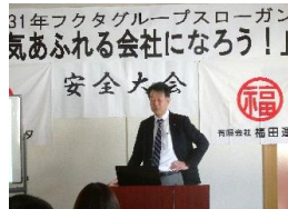
『ご機嫌カンパニーフクタ』を宣言！ 皆でご機嫌に仕事をして明るい会社になりますよ～！