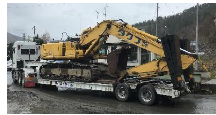
P C 220 長い間お疲れさま