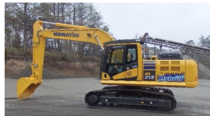
新 コマツ HB215

20年以上使用し老朽化が進んでいた油圧ショベルPC220を同じサイズのHB215に更新しました。HB215は、旋回エネルギーを蓄電し、動力をアシストするハイブリッド型油圧ショベルで、当社では2台目の導入となります。20%程度の燃費向上が期待でき、二酸化炭素排出削減にも寄与できます。それにしても、役目を終えてひっそりと搬出されるPC220を見ると、寂しさを感じます。ご苦労様でした。