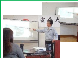
各部署ごとに分かれ事業計画や昨年度の 事業報告をしました。