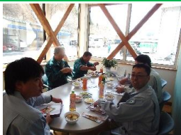
お弁当とトン汁が支給されました 皆でワイワイ、美味しかった！