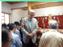
無事故無災害とみんなの健康を祈願しました。宗主様からは「人は人に尽くすために生まれてきた」とお話がありました。会長からは設立当時の貴重なお話をしてくださいました。