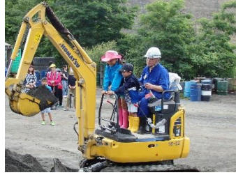
気分はすっかり遊園地♪