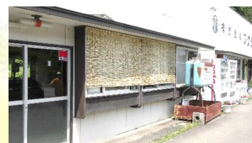
← 休憩室南側窓によしずを設置しました