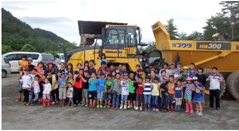
こんなに大勢の方がいらっしやいました！

毎年恒例となりました安代小学校の3年生の皆さんが今年も見学に来ました。時折小雨の降るあいにくの天気でしたが生徒17名、親御さん、兄弟を含めると50名を超える方々が来訪してくれました。発破作業を見た後、発破作業を見た後、各種重機の試乗体験をして頂きました。初めて触る重機に皆興味津々であったという間の2時間でした。