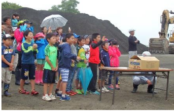
発破の瞬間を見逃すまいと皆集中！