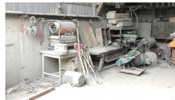
← 乱雑だった修理場がすっきりしました

7月も生産の合間に場内の整理整頓をしました。いらぬ物を捨てるだけで見違えるほどすっきりします。これからは一度整理された個所を元に戻さない努力と、さらにきれいに美しくしていく工夫を継続していかなければなりません。それは5Sの最後のしつけの部分です。今日より明日がきれいになるよう少しずつ取り組みましょう。