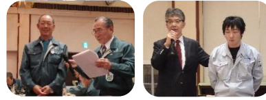
各部門で役職員紹介