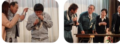
コーラ早飲みリレー