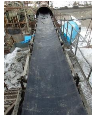
ベルトが新調された №1、BC

冬季休業中の 砕砂プラント の定期修理を実施しています。磨耗や腐食した個所の交換修理、ローラーの交換、ポンプ修理、コンベアベルトの交換等々、業者さんをお願いする部分も含めて、2月10日頃を目途に作業を進めています。終了次第早めの運転再開に向けて準備をしていきます。