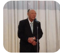
社長年頭あいさつ

仕事始めにあたる1月7日フクタ・福田運送全員により安全祈願を行い、一年の無事故無災害を誓いました。また安全祈願終了後、新年会を開催し、日頃職場が違い話す機会が少ない人同士も大いに懇親を深めることができました。この活力を仕事にも発揮して一年間頑張りましょう。