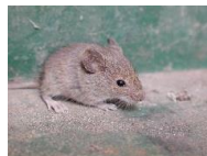
かなり小さいネズミでない?...

ある日のこと。『私の机の非常用のおやつ食べたの専務ですか?』と質問された。『???...』現場を見るとプラスチックの袋ごとちよどひとかじりしたようなビスケットの残骸があった。さらによく見ると、米粒くらいの黒い粒が数個落ちている。どうやら夜中にネズミが来ていたようである。その後同じ場所にやって来ては、紙をかじり、ウンチをしたりと目に余る乱交ぶりである。放っておけぬ事態となり、ネコいらずを設置した。毎日コンスタントに食べ続け、3日目位で黒い粒に赤い粒が混じり始め、一週間位で姿を現さなくなった。それにしてもネズミの踏破能力はすごい。未だにどうやって引き出しの中に侵入できたのか謎である。