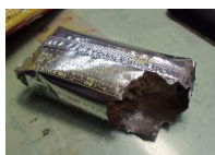
まるで人がかじったような