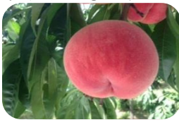
この色！とにかく甘い！

採りたての北限の桃は本当に甘くてビックリしました！ちなみにご馳走してくれたのは、 由右衛門果樹園 さんです！桃狩りもしているとってました。時期的には9月中旬が食べごろだそうです。おじさんご馳走さまでした。