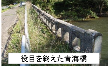
役目を終えた青海橋

今『コンクリート』は色々な意味で社会悪を象徴する言葉になっている。しかし世の中にはおびただしい数のコンクリート構造物がある以上、ただ悪いと言っているだけでは済