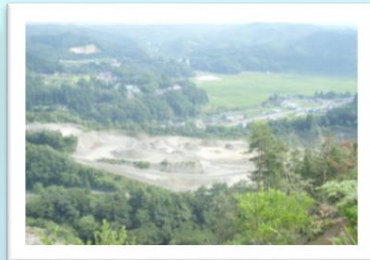
天台寺方向を望む