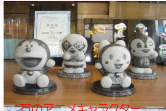
石のアニメキャラクター