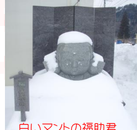
白いマントの福助君