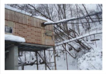
砕砂プラントの操作室に倒木