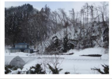
下平地区県道側 高木が根こそぎ倒された

年末年始浄法寺町でも記録的な大雪となりました。当工場でも倒木、停電等があり、除雪で仕事始めからてんやわんやでした。幸い仕事始めには電気は復旧していましたが、ご近所の方々は3日まで電気の無い生活を強いられ、不便で不安な日を過ごされたことと思います。お見舞い申し上げます。 現在、サツパ沢地区、復旧に向けて努力してまいります。 い個所もありますが、復旧に努めています。