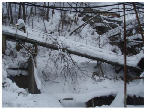
砕砂プラントのベルトコンベアへ倒木