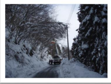
構内側電線にかかる枝