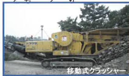
移動式クラッシャー

産廃処理施設の受入品目に『コンクリートくず』を追加しました。昨年からの許可取得へ向けて環境影響調査等の作業を進めてまいりました。この度取得となりました。発生したコンクリートくずの建設現場以外から発生したコンクリートくずの受入が可能となりました。コンクリートくずの移動式破砕処理ができることとなりました。