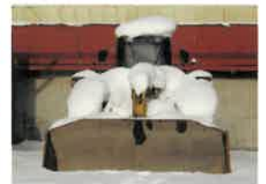
雪に埋もれたショベル

昨年中は何かとお迷惑をおかけしました。昨年一年振返って、ダンブが足らず『申しわけありません』と、お電話で謝つてばかりのだったように思います。どんなにやり繰りしても追いつかず、夕方以降の出荷をお願いすることしばしばでした。その節は皆様にご協力頂き感謝しております。今年も精一杯お客様の希望にお答えしていけるよう頑張りますのでくれぐれも宜しくお願いいたします。